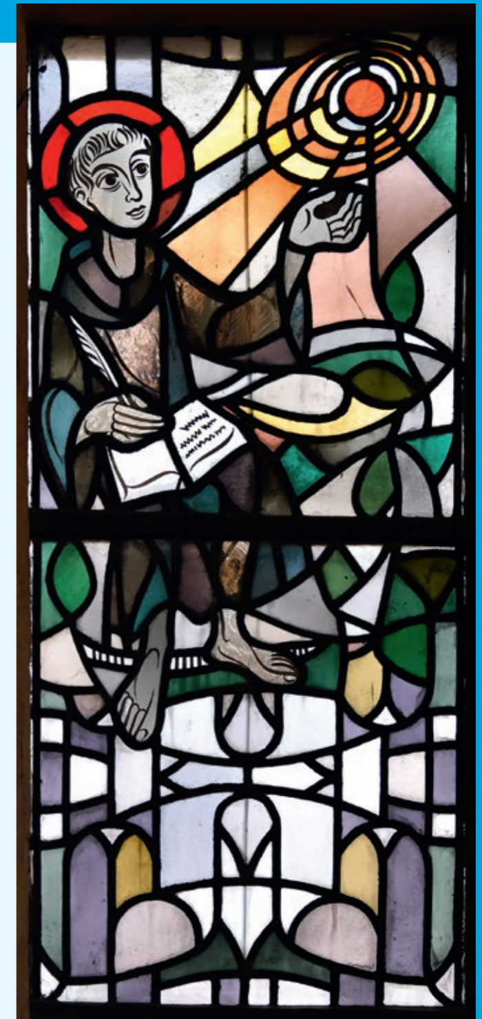
Ein Fenster in der Kirche St. Johann zeigt Franziskus beim Verfassen des Sonnengesangs