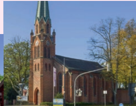
Ev. Alt-Hastedter Gemeinde