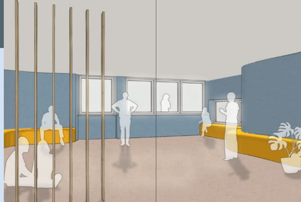
Der Pfarrsaal – mit Holzlamellen optisch von der Küche getrennt

Der Pfarrsaal im Erdgeschoss bleibt erhalten. Die Küche wird erneuert und etwas verkleinert, es soll eine Küchenzeile und eine Kochinsel eingebaut werden. Zwischen Küche und Pfarrsaal entsteht ein teiloffener, an zwei Seiten durch raumhohe Holzlamellen begrenzter Bereich, in dem Tische und Stühle untergebracht werden können, damit der Pfarrsaal variabel bestuhlt und mit Tischen eingerichtet wer-