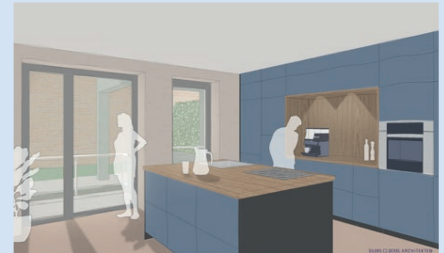
Die Küche im Pfarrsaal

Neben der technischen Modernisierung des Gebäudes hat die Pfarrheimsanierung das Ziel, einen Ort zu schaffen, an dem sich Menschen willkommen und in ihren Bedürfnissen ernst genommen fühlen. Im Antragsschreiben ans Bistum wurden diese Eigenschaften an das Pfarrheim genannt: gemütlich, multifunktional, prak-