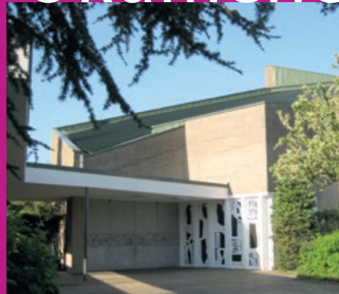
Kolumbariumskirche St. Elisabeth