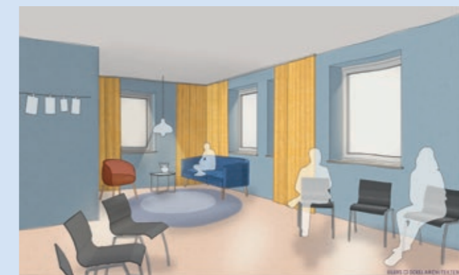
Der Gruppenraum im 2. Obergeschoss

tisch, spirituell, kommunikativ, und als Haus einer katholischen Gemeinde mit christlichen Inhalten gefüllt. Gemeinschaft, Verkündigung, Dienst am Nächsten als Grundvollzüge unseres Glaubens sollen auf jeder Etage sichtbar und erfahrbar sein. Wir sind zuversichtlich, dass dieses Vorhaben gelingt.