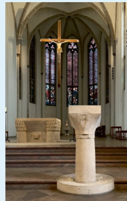
Der Ambo in der Kirche St. Johann

diese Hand wie eine, die zum Schwur erhoben ist, nach oben, meist aber nach unten, also sozusagen vom »Himmel« zur »Erde«. Dieses Symbol zieht sich dann durch alle Jahrhunderte bis in unsere Zeit hindurch, beispielsweise in der Kunst von Marc Chagall.